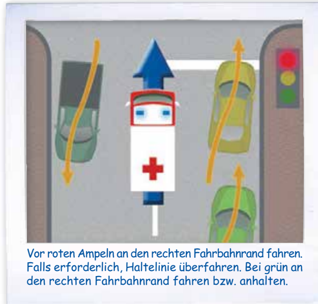
Vor roten Ampeln an den rechten Fahrbahnrand fahren. Falls erforderlich, Haltelinie überfahren. Bei grün an den rechten Fahrbahnrand fahren bzw. anhalten.