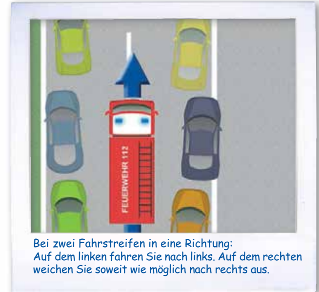
Bei zwei Fahrstreifen in eine Richtung: Auf dem linken fahren Sie nach links. Auf dem rechten weichen Sie soweit wie möglich nach rechts aus.