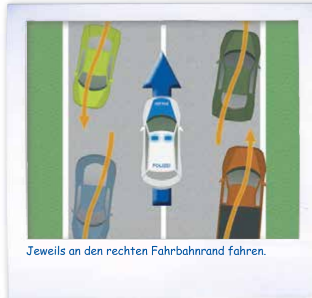
Jeweils an den rechten Fahrbahnrand fahren.