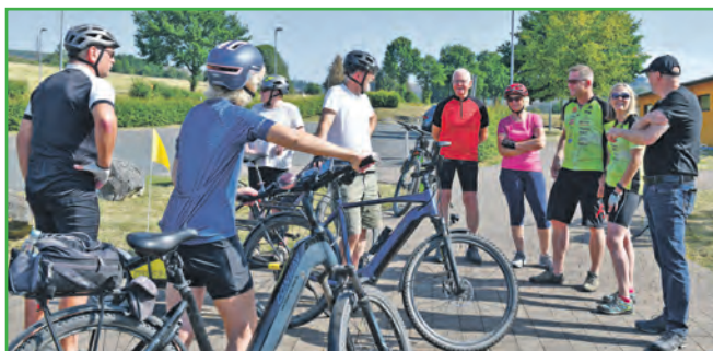
Stadtradeln Premiere 2023 in Dietzhölztal.

Vom 22. Juni bis 12. Juli gibt es 21 geführte Fahrradtouren für alle „Stadtradler“